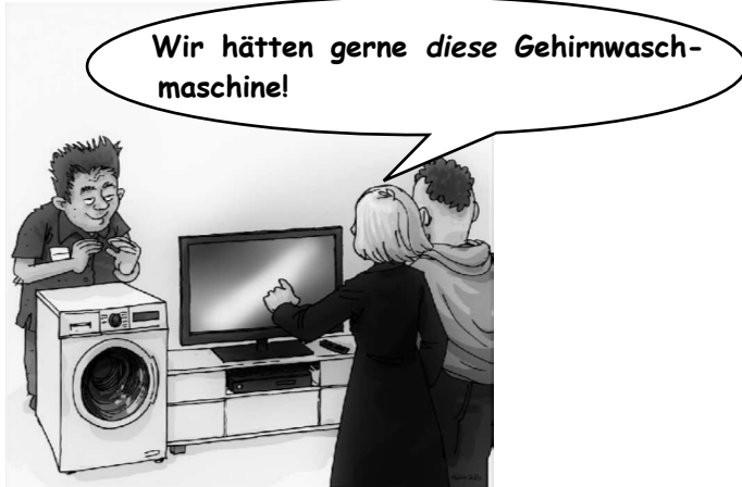
Das große Corona-Cartoonbuch, S. 31, Hinz Verlag, sabinehinz.de, Zeichner Frans Stummer, frans-stummer.de

Das große Corona-Cartoonbuch, S. 54, Hinz Verlag, sabinehinz.de